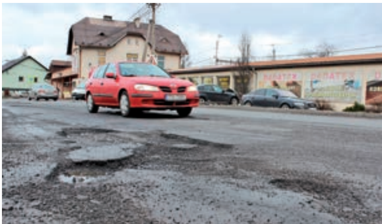
DÍRY. Opravovat se bude, až to počasí dovolí.

Situace nijak netěší ani vedení Vendryně, kde se díram v silnici řidiči opravdu jen stěží vyhnou. „Víme, že konkrétně na Černovském u ostrůvku a Hondy se tento problém bude na jaře opravovat včetně obnovy podkladních vrstev. Věřme, že se dočkáme obchvatu