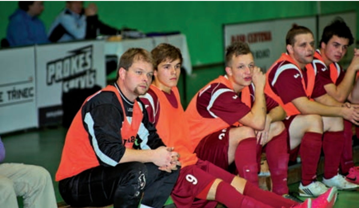
NENÍ TO ONO. Kam se poděla naše podzimní suverenita, dumají futsalisté Třince.