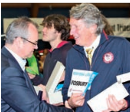
ČESTNÝ HOST. Do Vendryně zavítal vynálezce flopu, Američan Dick Fosbury – olympijský vítěz z roku 1968.