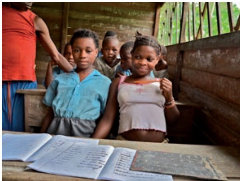
ŠKOLA. Mladý cestovatel je i součástí českého sdružení Kedjom-Keku, které podporuje vzdělání afrických dětí.

Několik měsíců strávím v divočině s protipytláckými hlídkami a také budu pomáhat ochranářům se zpracováváním materiálů a videí pro jejich osvětovou činnost. Přiložím ruku k dílu, kdekoli to bude potřeba. Nyní jsem mého mladého hostitele z Kamerunu zaslavil do svého tajného plánu: vypátrat překupníky se slonovinou. Jméno i tvář mého spoluspiklence zůstanou pro jeho bezpečnost zatím utajeny, říkejme mu třeba Fanfán Tulipán. Fanfán bude během třičtvrtě roku, než se do Kamerunu na konci své cesty opět vrátím, zjišťovat, kde je možné získat sloní maso. I když trhy nabízejí široký sortiment takzvaného „bushmeatu“, ilegální sloní maso nebývá ve výloze a na menu. To však neznamená,