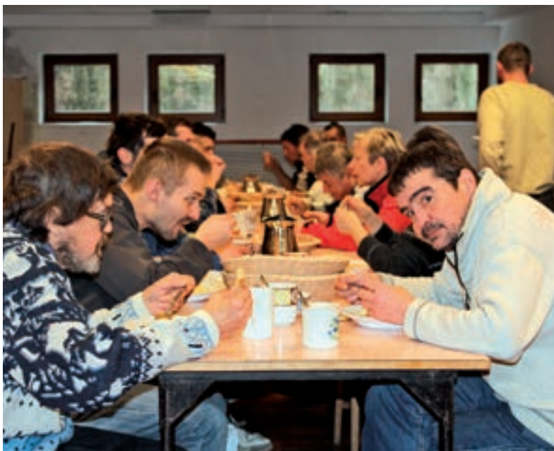
U STOLU. Polévka bude lidí v nouzi zahřívát po celý měsíc.

Potřební se při talíři teplé pochutiny schází vždy v úterý a ve čtvrtek od 10 hodin. „Jde o střet dvou světů, cítí se tak být alespoň na chvíli jedněmi z nás.