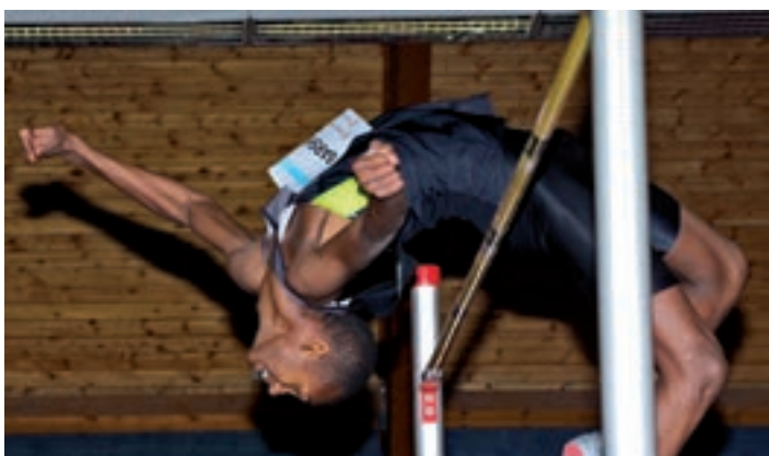
VYCHÁZEJÍCÍ HVĚZDA. Vítězný Katařan Mutaz Essa Baršim (234 cm) vyrovnal rekord mítinku.