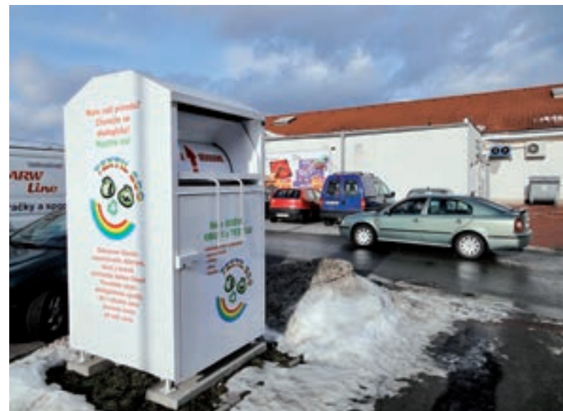
BÍLÝ KONTEJNER. Slouží na textil a obuv.

Zavedení sběru tříděného textilu je další formou třídění, která je cestou ke snížení množství komunálního odpadu ukládaného na skládku a zároveň přinese městu úspory za jeho odstranění. Doposud tento odpad končil převážně v nádobách na směsný odpad nebo v pytlích na stanovištích u kontejnerů, případně na sběrném dvoře a následně