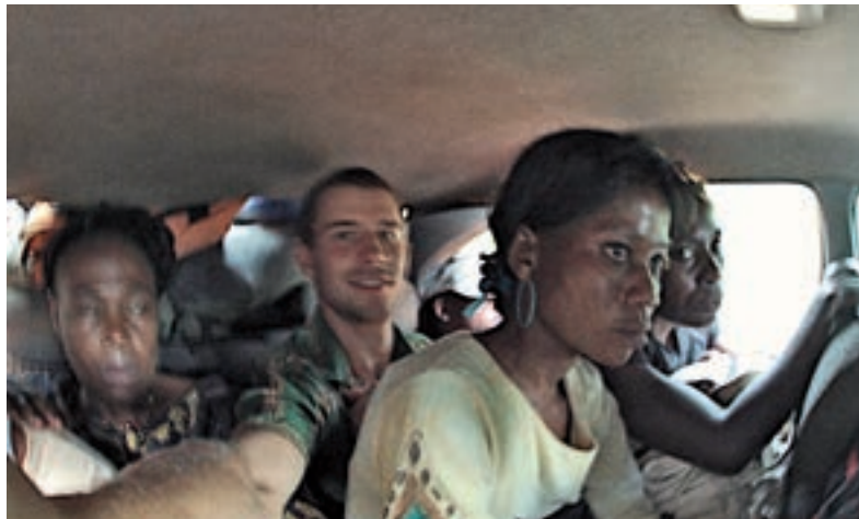
CESTOVÁNÍ. I 15 lidí se musí vejít do pětimístného auta.

že není k dostání. Fanfán Tulipán je rodilý Kamerunec, mluví francouzsky i anglicky a k tomu několika domorodými jazyky. Když se ve vytipovaných restauracích začne shánět po sloním steaku „pro svého šéfa“, nebude budit velkou pozornost. Příležitostně párkrát ten steak opravdu koupí a postupně se začne nenápadně vyptávat. Po několika měsících známosti s prodejci masa nadhodí, že by jeho šéf měl zájem o slonovinu... a to už budu opět v Kamerunu i já a snad se nám podaří něco vypátrat. Ať ale nepředbílám: zpět do současnosti! Jednoho rána mě Tulipán doprovodil na odjezdíště minibusů směrem na východ do městečka Abong-Mbang. Tam končí asfalt a začíná moje cyklistické dobrodružství. PETRA MARTYNKOVÁ