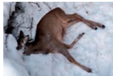
OBLEVA. Myslivci sčítají uhynulé kusy.

Když se na sněhu vytvoří ledová krusa, tomuto terénu se přezdívá zabíjác zvěře. Led se pod sněhem boří a velmi snadno jí pořeže nohy. Je lepší, když nemusí putovat za potravou z velké dálky.