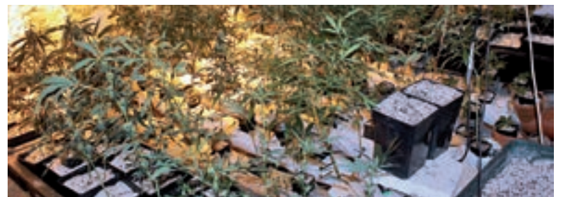
PĚSTÍRNA. Někteří si doma vybudují hotovou továrnu na výrobu drogy.

V září 2012 zase kriminalisté sdělili podezření třicetiletému muži, který pro změnu pěstoval konopí přírodní formou přímo na zahradě rodinného domu. Na