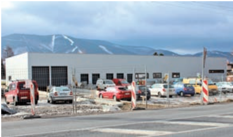
FINIŠUJÍ. Výstavba depa v Oldřichovicích míří do finále.

Pěťadvacetimilionová investice nabídne pracovní místa přibližně pro 40 osob. Ty ovšem obsadí převážně stávající zaměstnanci, s novými posilami Česká pošta nepočítá. Spuštění překládání, třídění, přijímání či vydávání zásilek v Ol-