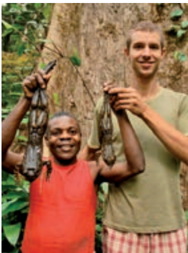
OBŽIVA. Žáby, krysy či dikobrazy jsou v Africe na denním menu.

► Hlavním úkolem vaší výpravy je ochrana slonů. Jak pokračují vaše plány?