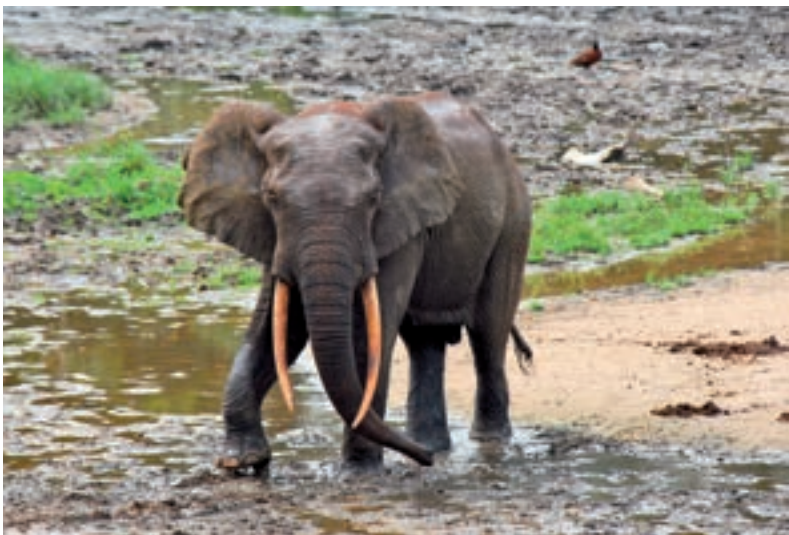
SLONI. Jsou hlavním zájmem mladého cestovatele. Bojuje za jejich záchranu.