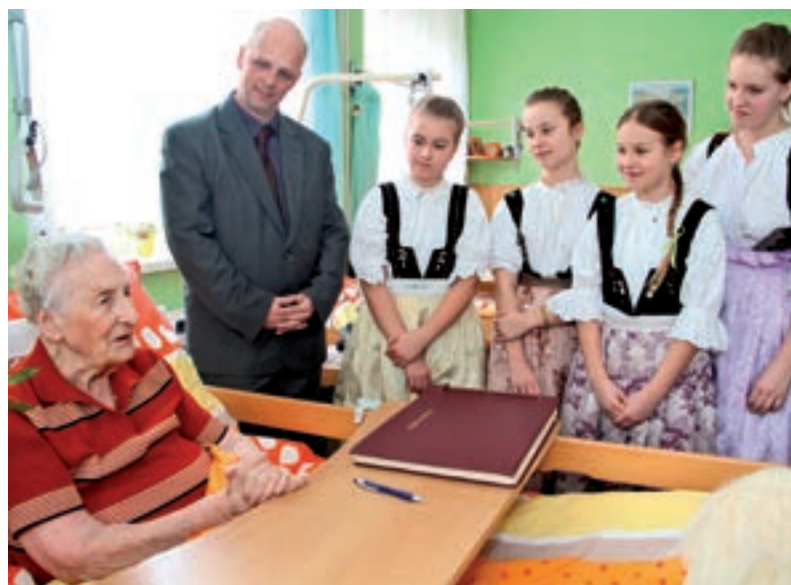
V KROJÍCH. Také pro děvčata v krojích byla návštěva jubilantky zážitek.