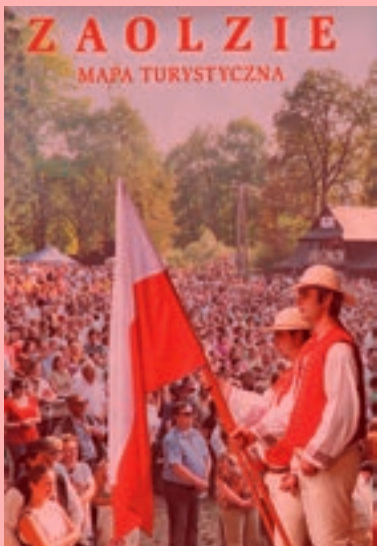
OBÁLKA. Českým starostům se nelíbí, že na obálce chybí česká vlajka. Polská strana tvrdí, že nebyla potřeba, protože mapa byla vytištěna pro Poláky, a dodává, že na původní fotografii, z níž se tvořila obálka (vpravo), česká vlajka chybí.