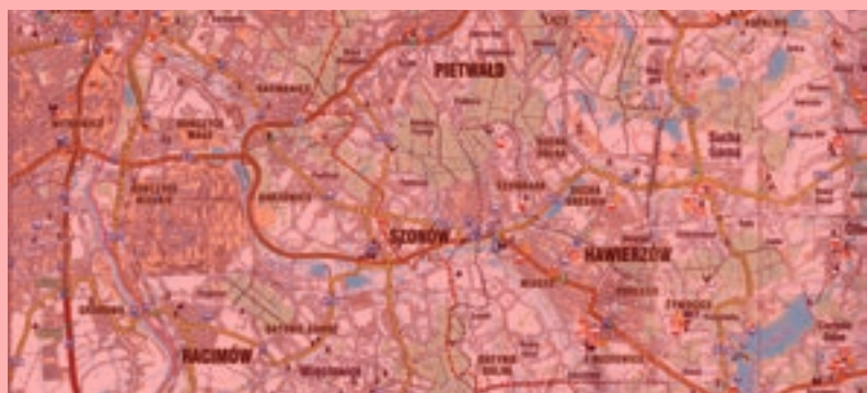
MAPA. Na mapě jsou všechny názvy v polštině a jsou na ní zakresleny také kontroverzní historické hranice z roku 1918 a 1938.

Výhrady mají starostové i k samotnému názvu mapy. „O turistickou mapu se podle mě nejedná, byly by zde totiž vyznačeny trasy podle značek (na Javorový, na Loučku, cyklostezky atd.). Ve slovním popisu (v polském jazyce)